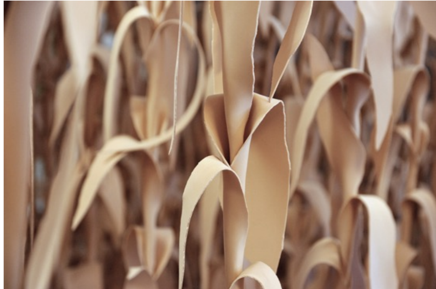
השדה, 2012, פרט מתוך הצבה, Pavillon am Milchhof, Berlin

העבודה הוצגה במסגרת פרויקטים מיוחדים, צבע טרי 5, 2012, Pavillon am Milchhof, ברלין, 2012. אוצרת: Lindy Annis. ו EXPO 2015, מילאנו, איטליה. אוצרת: כרמית בלומנזון.