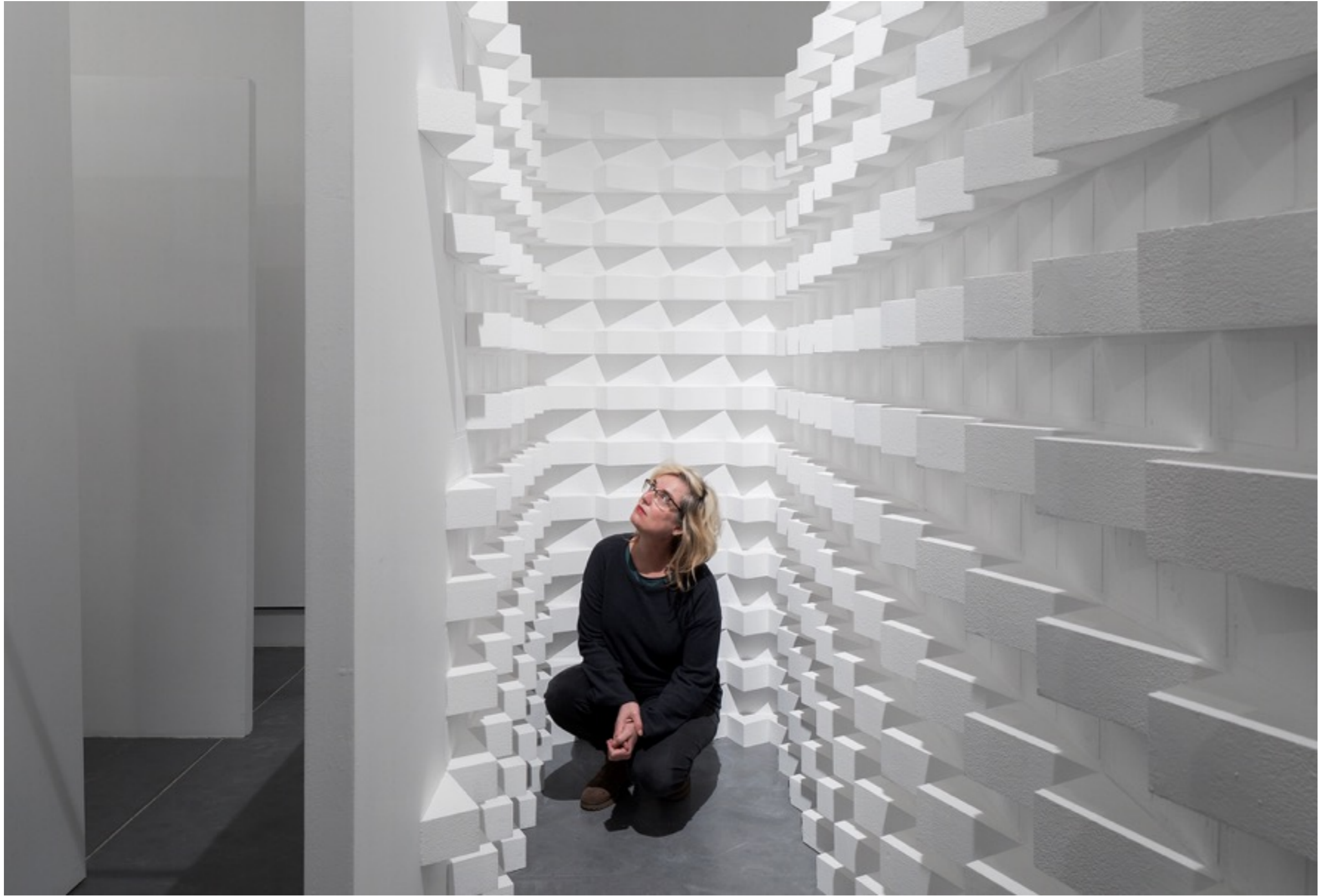
המבוך, 2021, פרט מתוך הצבה, מוזיאון פתח תקווה.