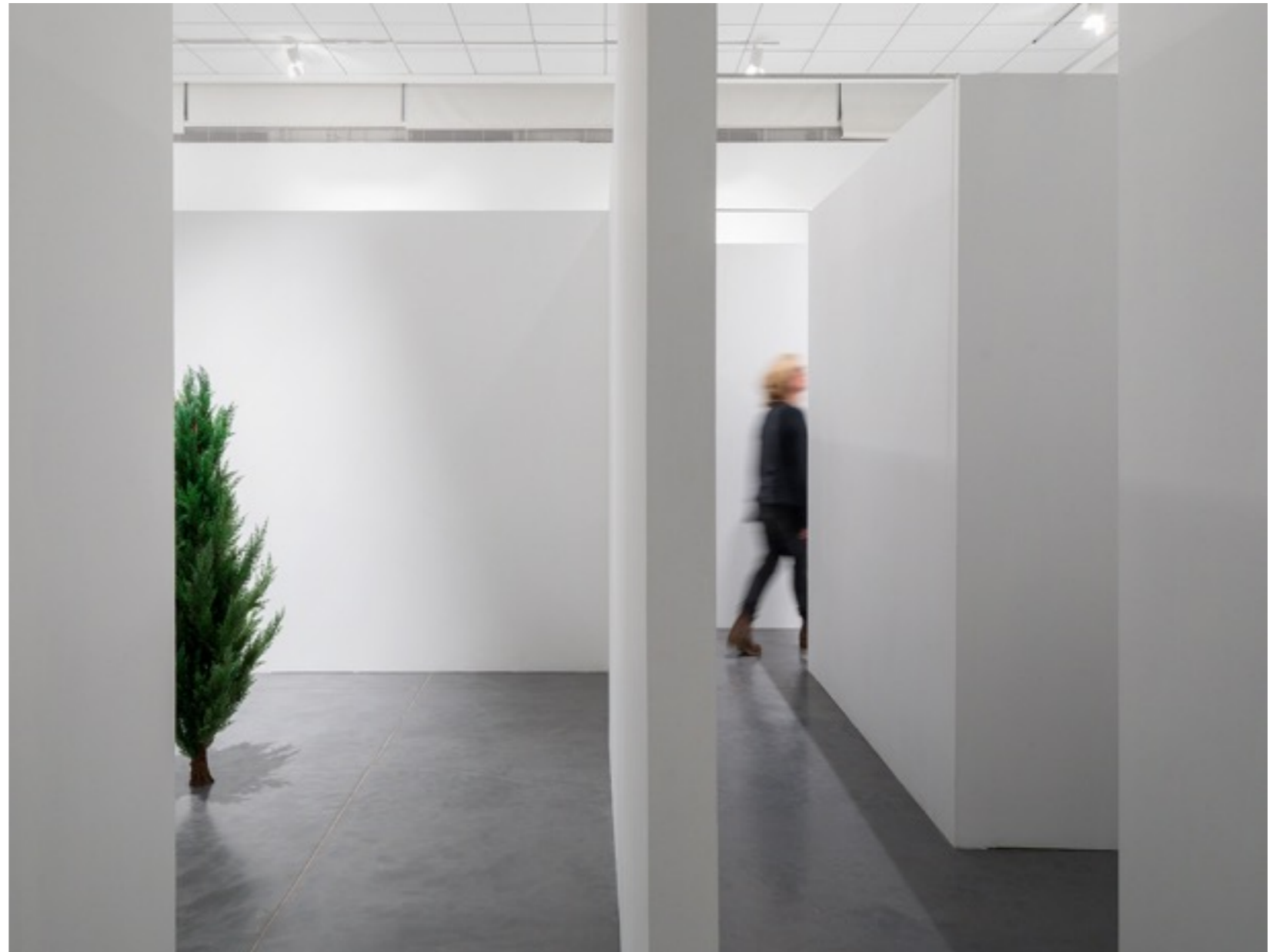
המבוך, 2021, מבט על הצבה, מוזיאון פתח תקווה.