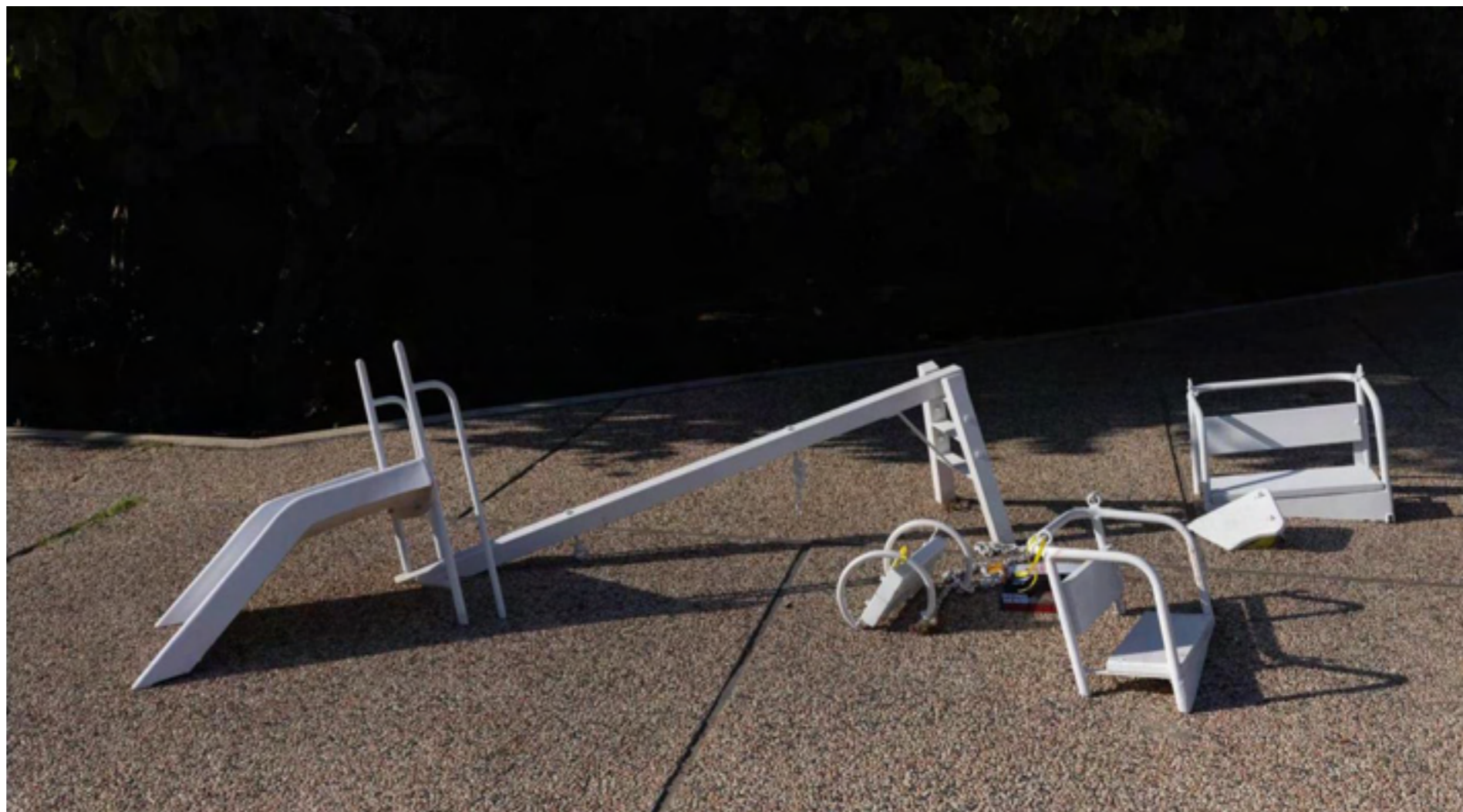
Playground , 2010 , פרט מתוך הצבה, כיכר החטופים 2023, תל אביב.

הקישור בין גן שעשועים, המתקשר להנאה, ילדות, תמימות ושמחה עם אלמנט ה"קבורה", יוצר מתח שהומל חוקרת במרבית מעבודותיה. גן השעשועים מקבל מהפך אפוקליפטי ע"י פעולת ה"קבורה". כאשר חציו של המתקן מוסר ממנו, הוא הופך לאובייקט פיסולי בתוך הנוף ומאבד לחלוטין את הפונקציונליות והצורה ה"אורגנית" שלו. יחד עם זאת, גן השעשועים, בפני עצמו, הינו מיצב עירוני שכיח ומסמן אזורים מגורים, חיים פעילים. כאשר חלק מאתר השעשועים הזה נקבר בקרקע, פעולות החיים בתוך האובייקט מתבטלות. המתקנים הופכים לאובייקטים ארכיאולוגיים שניקו מהם את החול והאדמה והם הוצבו לראווה וצפייה במוזיאון. זוהי פרודיה על קטסטרופה, מוות ואימה והתעמתות עם הנסתר והנגלה.