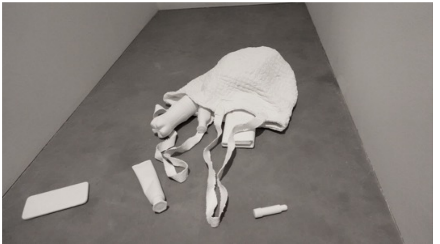
המבוך, 2021, פרט מתוך הצבה, מוזיאון פתח תקווה.