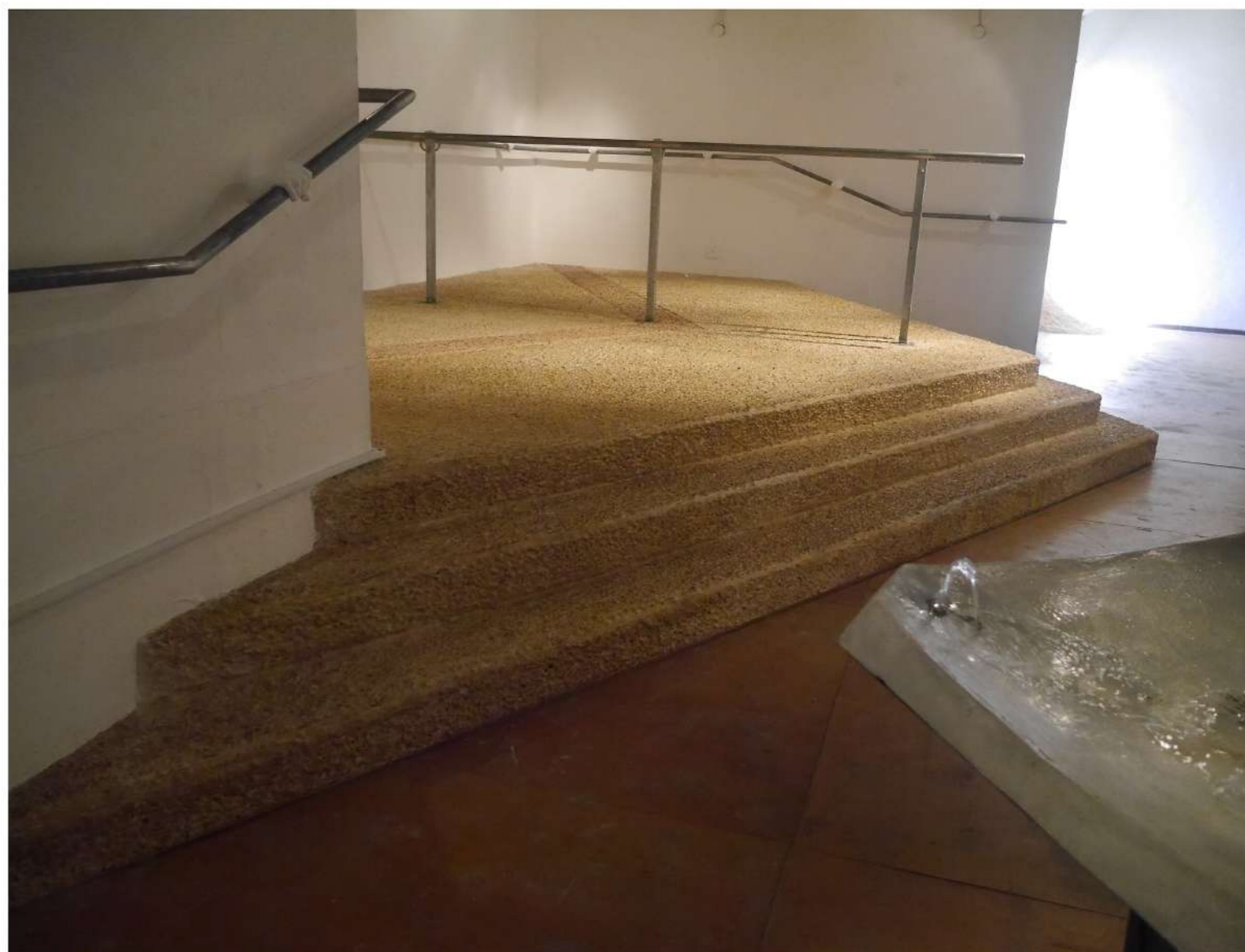
1 1/3 טון, 2017, מבט על הצבה, גלריית קו 16.

המיצב כולו מציע לצופה כיכר אלטרנטיבית, מקום מפגש, המאמת אותו עם החומרים המוכרים של החברה הישראלית, מעלה אותם ל"דרגת" אמנות ומפעיל את הדיון על האני- עצמי והאחר הזר.