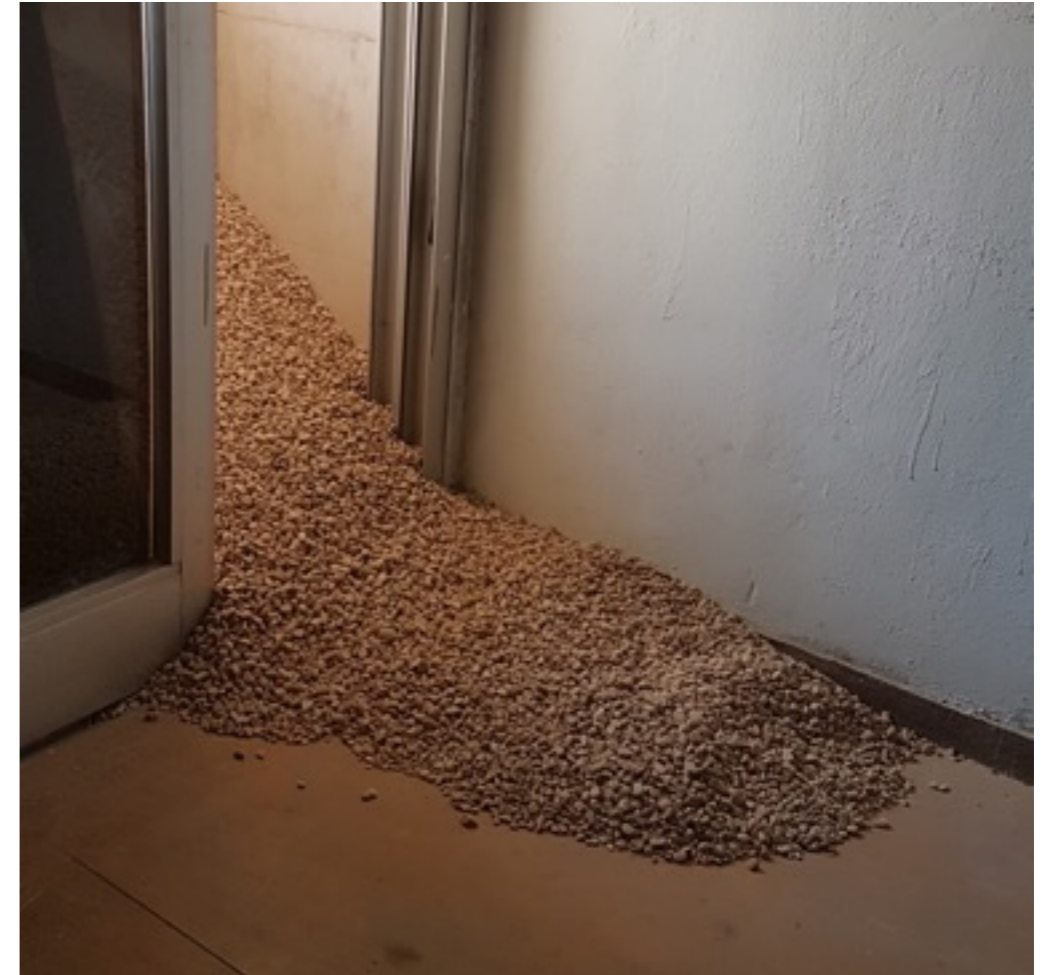
1/3 טון, 2017, פרט מתוך הצבה, גלריית קו 16.