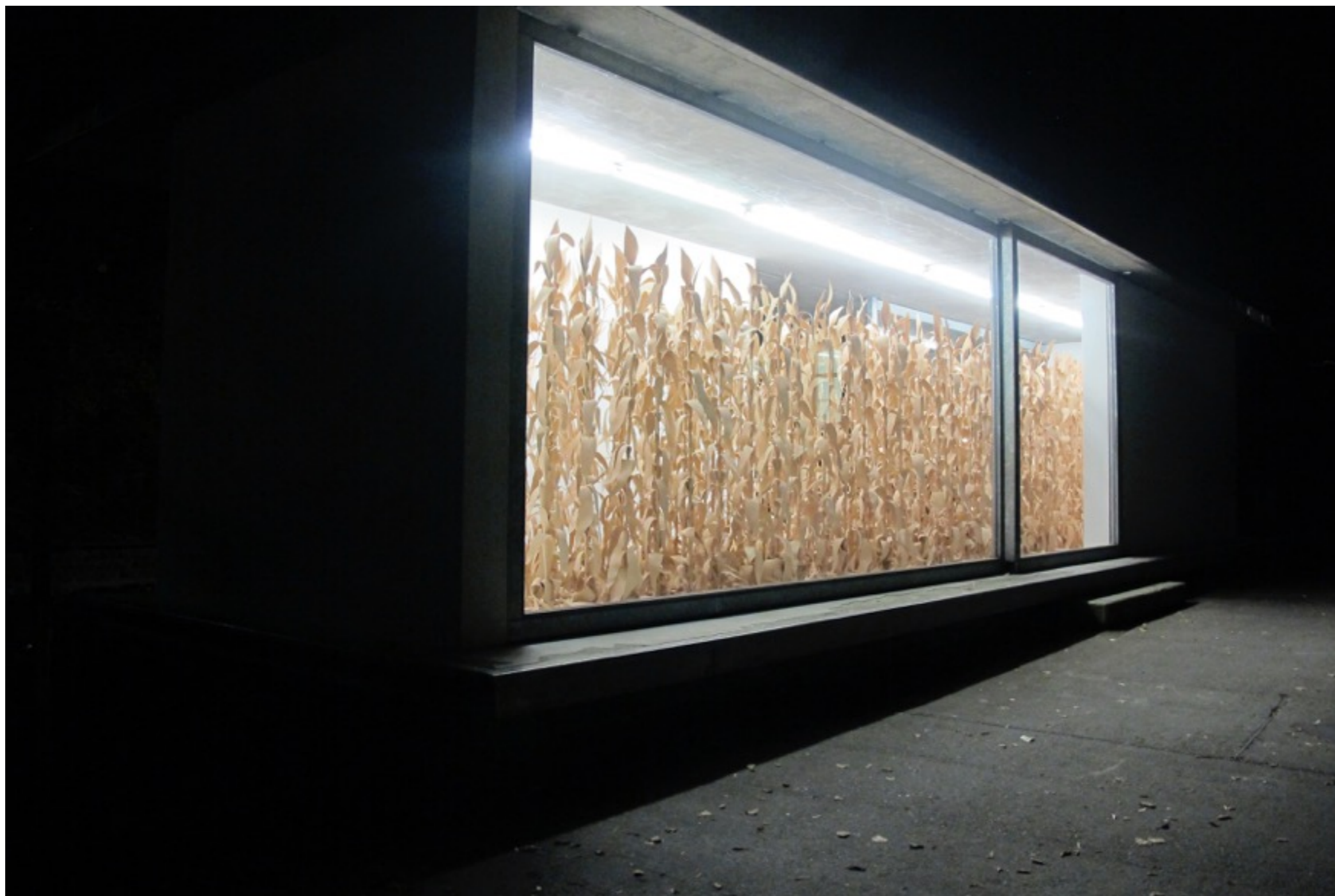
השדה, 2012, מבט על הצבה, Pavillon am Milchhof, Berlin, צילום: שירה טבצ'ניק