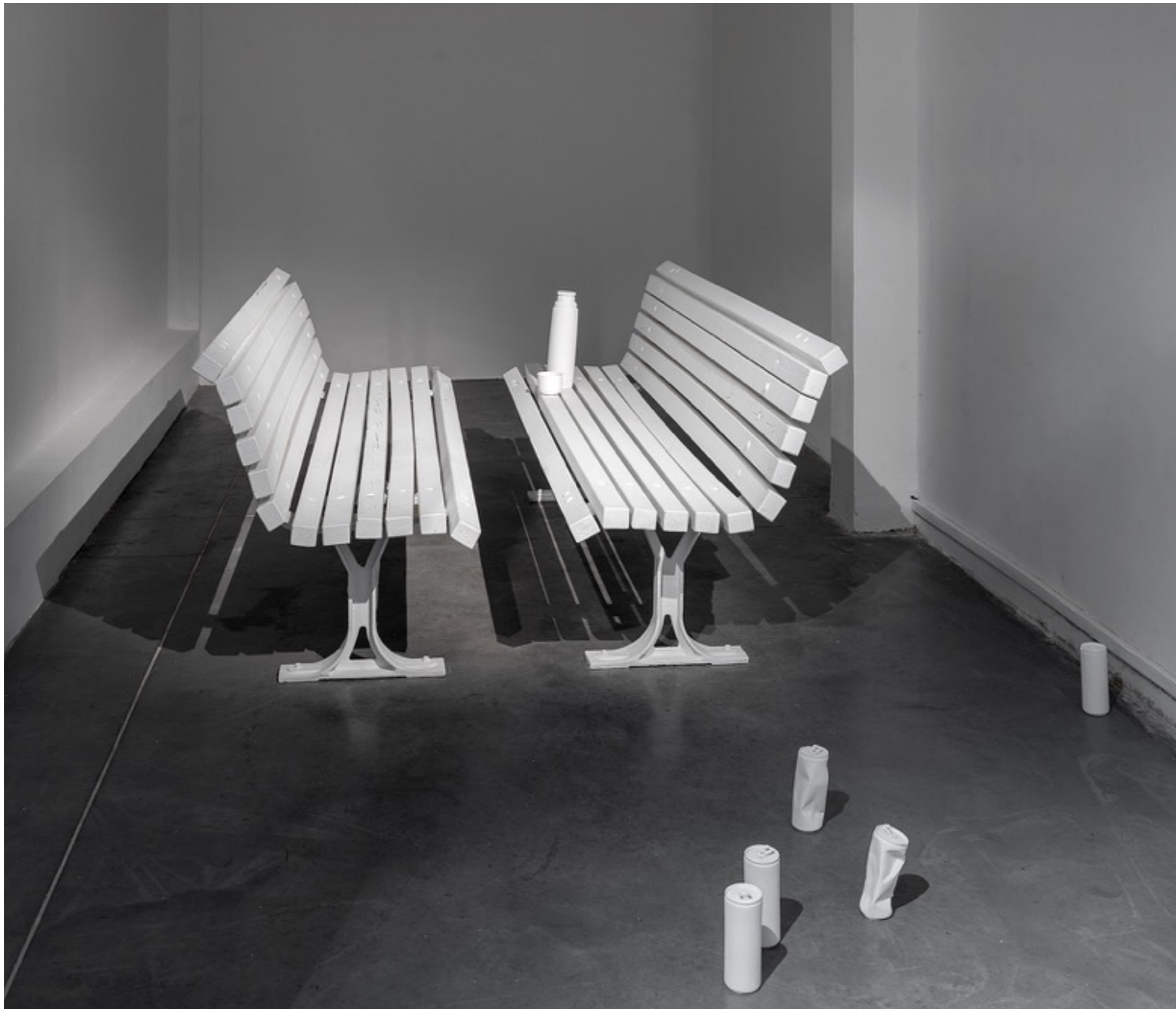
המבוך, 2021, פרט מתוך הצבה, מוזיאון פתח תקווה.