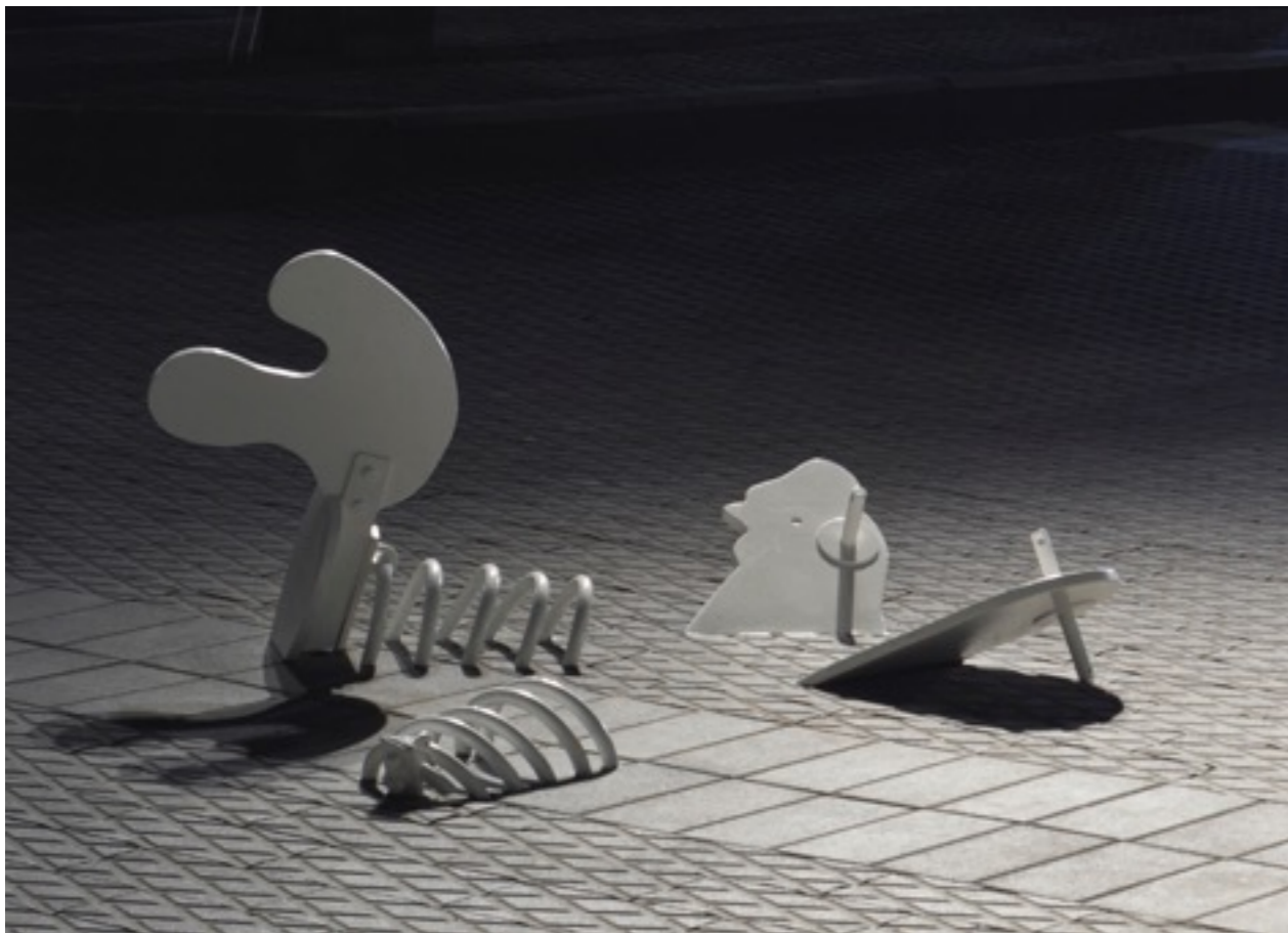
Playground , 2010 , פרט מתוך הצבה, צבע טרי 3.