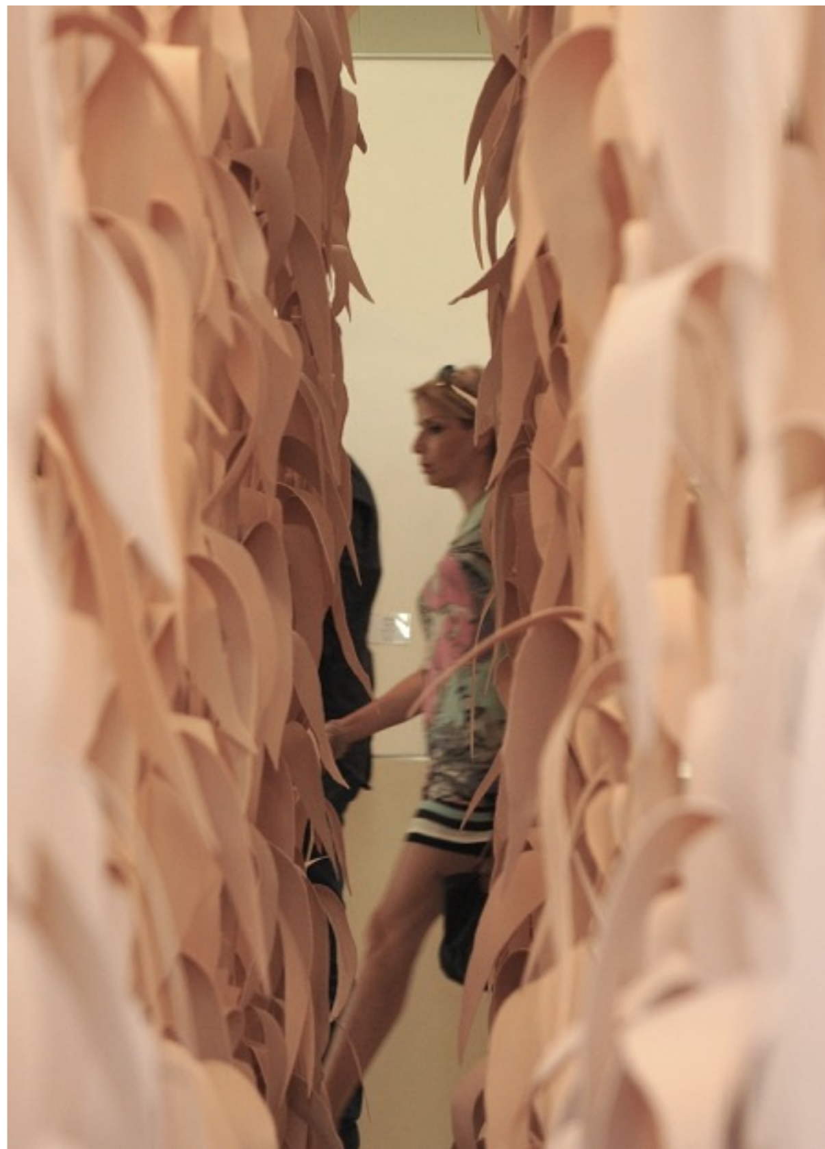
השדה, 2012, פרט מתוך הצבה, Pavillon am Milchhof, Berlin, צילום: גיורא פנחסי