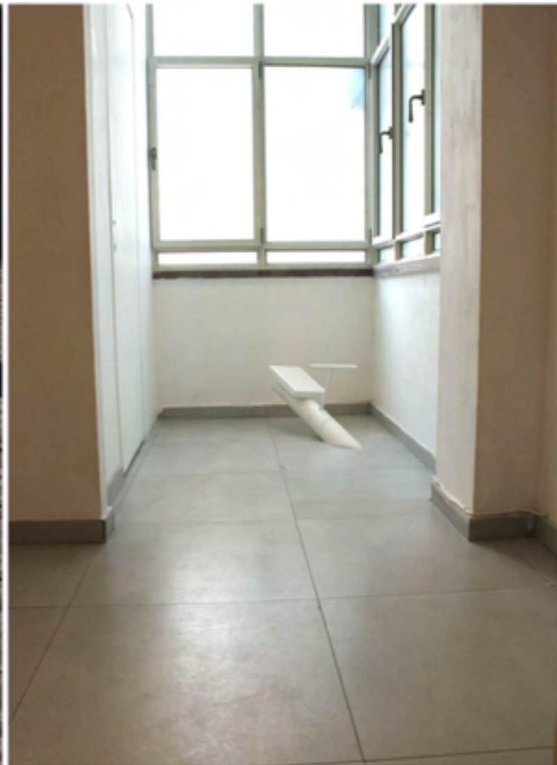
2011, Playground, פרט מתוך שלוש הצבות שונות- מוזיאון חיפה, גלריית גל-און ובכיכר החטופים 2023.