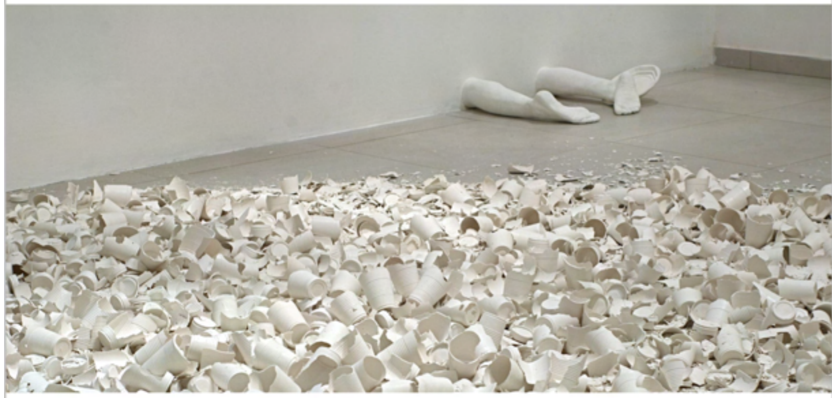
רקוויאם: הפיקניק, 2010, פרט מתוך הצבה, גלריית גל-און, צילום: האמנית