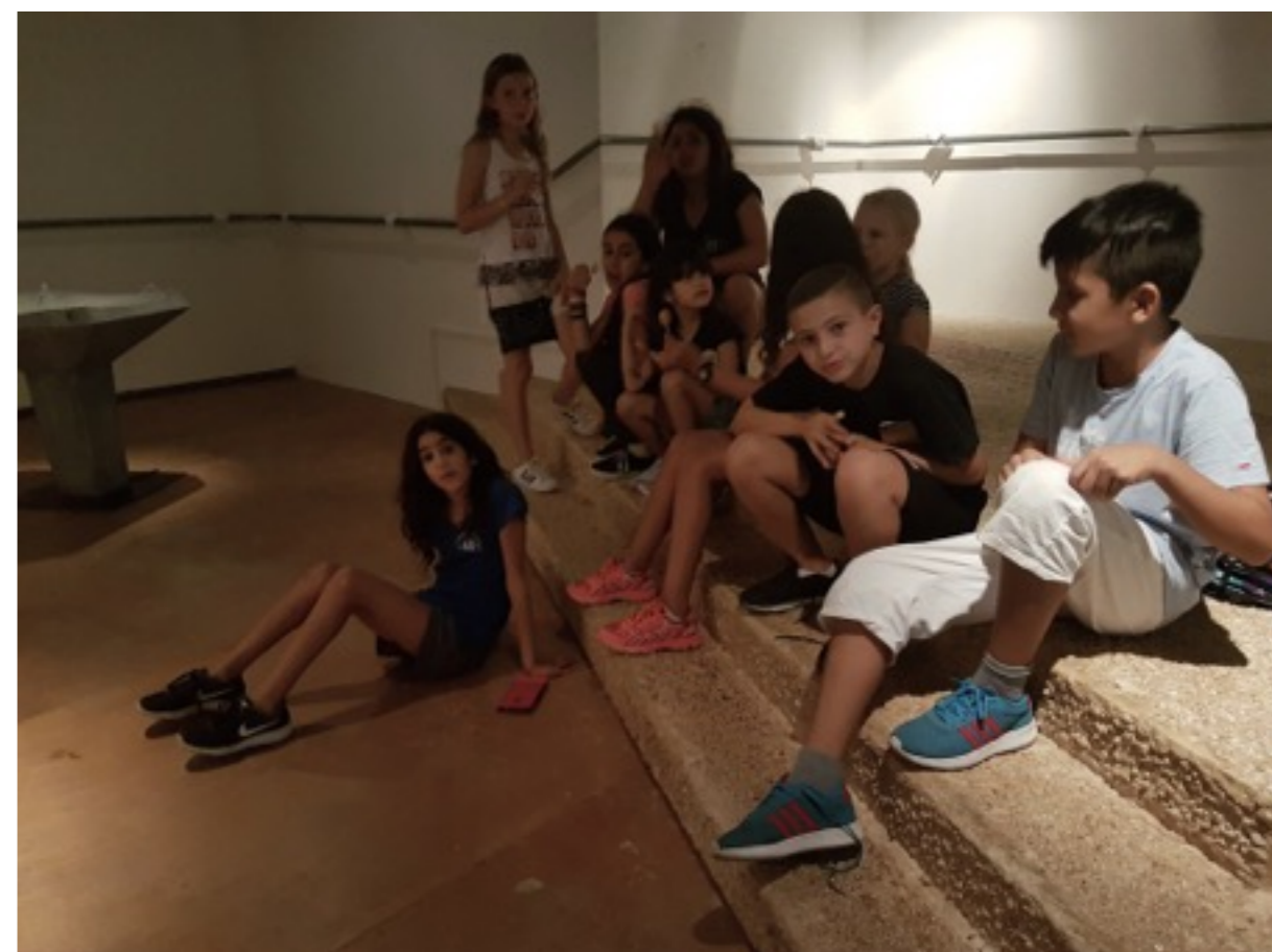
1/3 טון, 2017, תיעוד סטילס-עבודה עם הקהילה, גלריית קו 16.