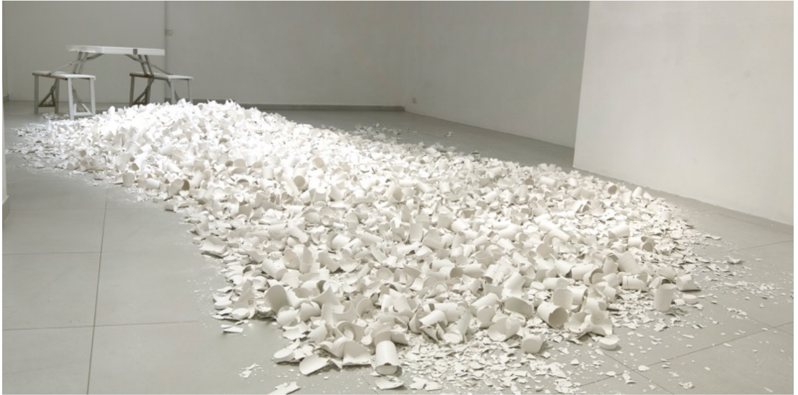
רקוויאם: הפיקניק, 2010, פרט מתוך הצבה, גלריית גל-און